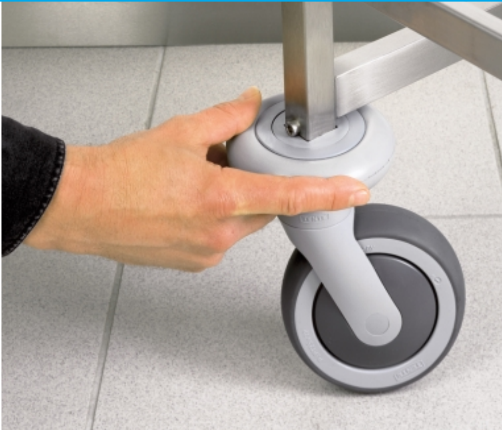
Ein Highlight aus dem HUPFER®-Zubehörprogramm ist der zum Schutz des Inventars und der Wände entwickelte drehbare Wandabweiser.