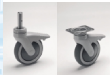
Nichtrostende Kunststoffrolle mit Kugellager, geeignet für den Naßbereich. Je nach Modell mit Zapfen- oder Plattenbefestigung aus Chromnickelstahl 18/10, Werkstoff 1.4301 lieferbar.