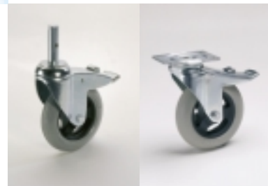
Rostgeschützte Rolle mit Kunststoffrad und luftdichtester Lauffläche, kugellagert in verzinkt-chromatisiertem Gehäuse. Dieser Rollentyp sorgt für minimale Fahrgeräusche und ist besonders für unebene Fahrwege geeignet.