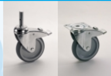
Standardmäßig rostgeschützte Rolle in verzinkt-chromatisiertem Gehäuse, mit Kunststoffrad und Gleitlager. Je nach Modell mit Zapfen- oder Plattenbefestigung lieferbar.